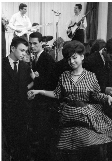
Illés zenekar koncertje:1964 BME Rózsa Ferenc Kollégiuma, Bercsényi Klub

A hagyományos művészetek háttérbe szorultak, míg a kísérletező, experimentális irányzatok teret hódítottak maguknak. A szervezők újításként tematikus kiállítássorozatokot rendeztek.